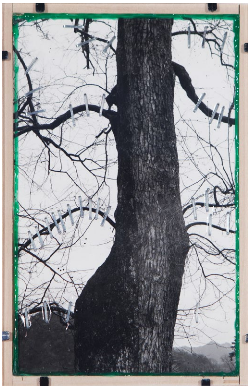
《情放志蕩-夏至-047》，2018年 馬釘，拼貼照片，熱熔膠 18.6 x 12.1 x 2.5 厘米 7 3/8 x 4 3/4 x 1 英寸