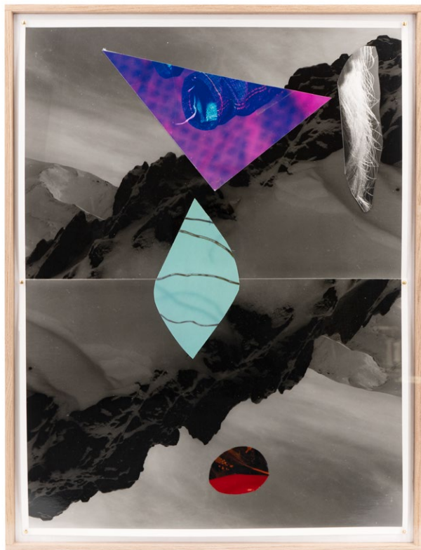
《AW-013-C001》，2020年 拼貼照片 36.7 x 28.5 x 4 厘米 14 1/2 x 11 1/4 x 1 5/8 英寸