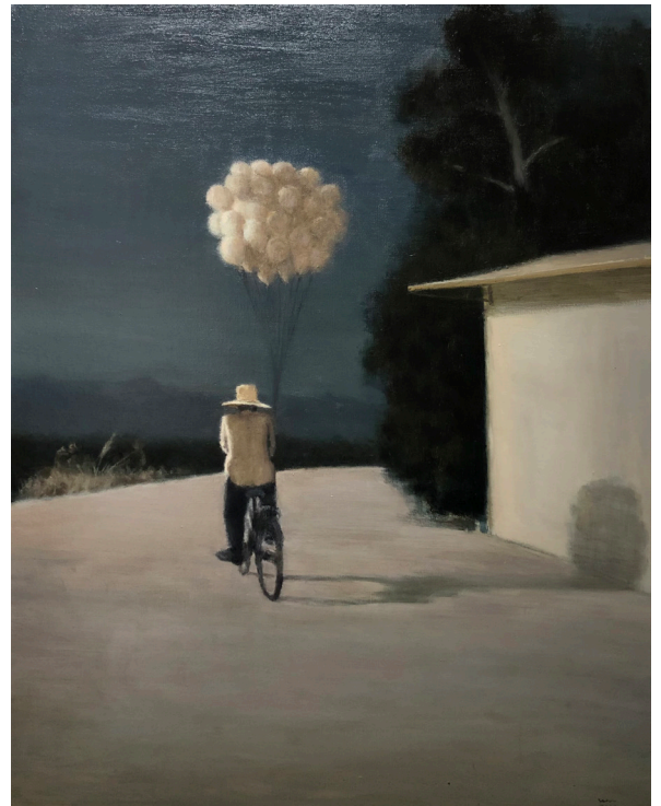
伍思波，《賣氣球的小販》，2022年 100 x 80 釐米，布面油畫

此次展覽可以看作是一次對「家」的想像與質詢，關於家的探索往往是隱藏於藝術家背後的是一個經典的創作衝動，在不同的歷史和文化場景中有不計其數的變形，它時而指向歷史上那些被稱為離散的族群在新的地方尋找建立故土的訴求，時而又變身成為藝術家原生家庭的某種投射。在經歷了新冠大流行的三年後，家與家庭空間產生出截然不同的面向，它的媒介意義在困境中被加以放大，它讓身體切斷了與在地之間的親密聯繫。流浪中的人在別處找到了臨時或永久的新家，留在原地的人面對著模糊了日常與工作邊界的家庭空間。事情不再是原來看起來那樣，家變成隔離的地方，隔離的地方變成家。四組背景迥異的藝術家作品，分別從風景、空間和離散等三個角度對家提出了質詢，並提示著該行動背後的權利機制給當下帶來的困難與緊張。